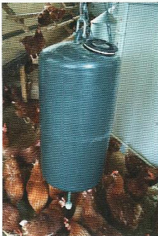
HüBA 70 l mit montiertem Maisstößel auf der Pendelstange.

Zwei Beschäftigungsgeräte stehen zur Auswahl: Der HüBA 70 l für 190 Euro inklusive MwSt. ab Werk mit Kette zum Aufhängen, die Futterdosierung erfolgt nach Herausdrehen des unteren Behälterdeckels. Der HüBA 180 l mit Befestigungsketten und Kettenspannern zum Anbringen an einem Baum kostet 390 Euro inklusive MwSt. ab Werk. Die Futtermengendosierung erfolgt hier per Schieber von außen.